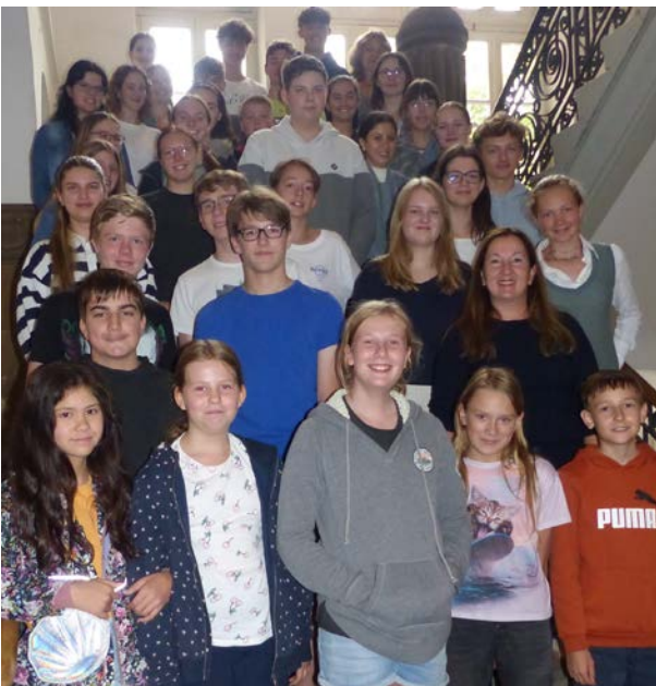
Alle Teilnehmenden am Abschlusstag, 1.9.2023.

Abgeschlossen wurde die Woche mit feierlichem Überreichen der Urkunden für die Trainierenden durch Frau Neuner und einem gemeinsamen Foto auf der Treppe vor dem Sekretariat.